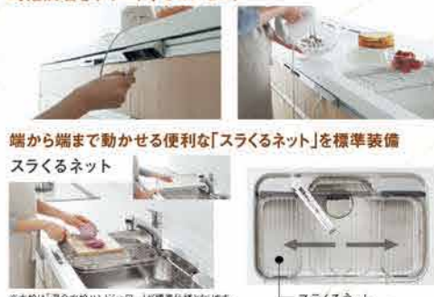
※水栓は「混合水栓ハンドシャワー」が標準仕様となります。

料理も片付けもキッチンと家族が奥様をサポート 短時間調理をサポートするコンセント